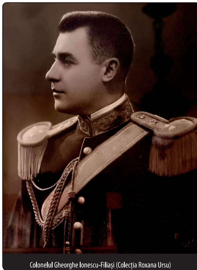
Colonelul Gheorghe Ionescu-Filiași (Colecția Roxana Ursu)

Foarte inteligent, cu o memorie remarcabilă, cu o putere de muncă inepuizabilă, cu o energie mereu crescândă, cu o educație perfectă, cu cea mai mare bunăvoință în și afară din serviciu, cu zel și pasiune pentru carieră, căpitanul Ionescu este merit să se