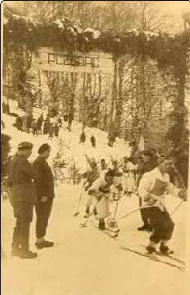
Martie 1944. Aspect din instrucția de iarnă a vânătorilor de munte

sporturile. S-a ocupat cu schiul, căutând a-și menține antrenamentul. S-a ocupat cu vânătoarea. Prestanță. Ținută foarte îngrijită. Poate suporta ușor rigorile unei campanii. Foarte bune aptitudini fizice.