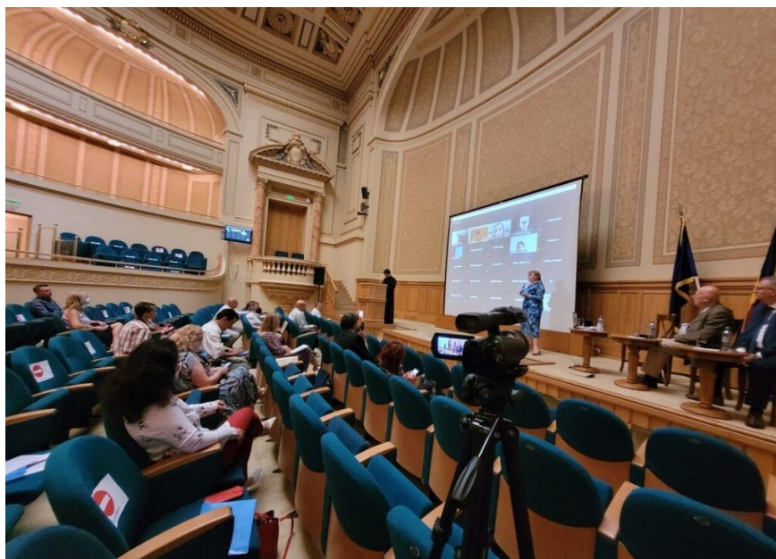
Simpozion „Slove Muscelene” 2021 – Aula BCU București