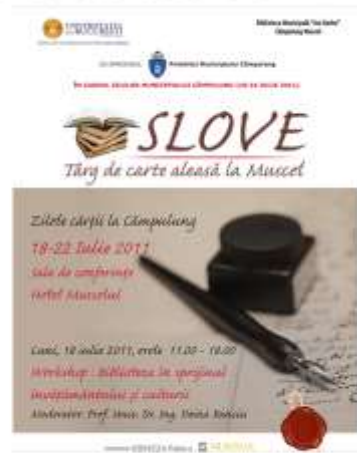
2011 – workshop: Biblioteca în sprijinul învăţământului şi culturii