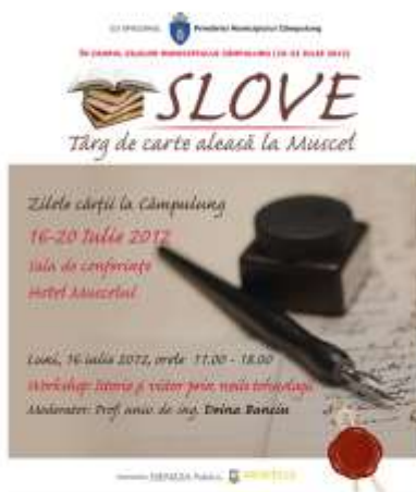
2012 – Istorie şi viitor prin noile tehnologii