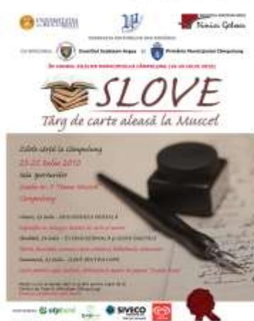
2010 – Târgul de carte aleasă la Muscel