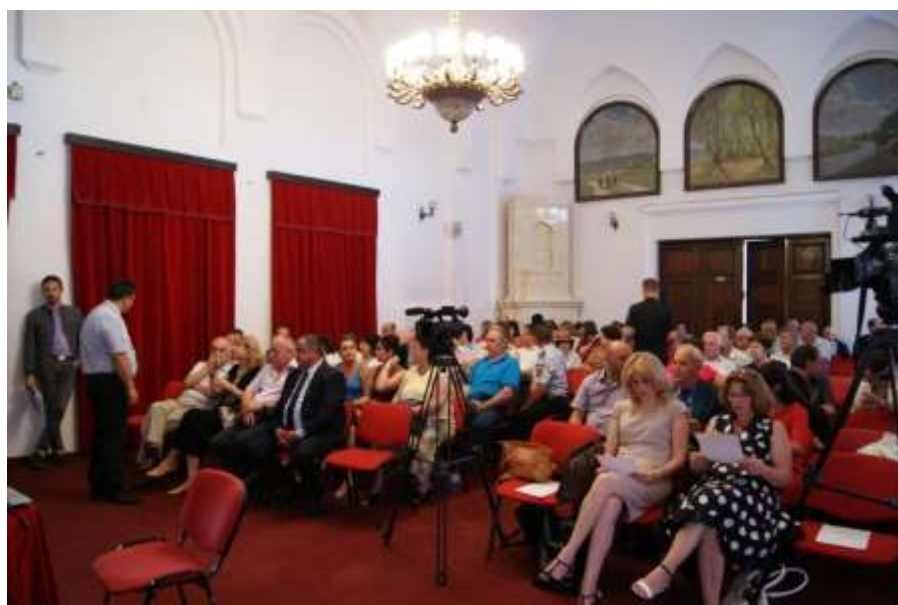
Sala Primăriei – participanți la Simpozionul „Slove Muscelene“ 2015