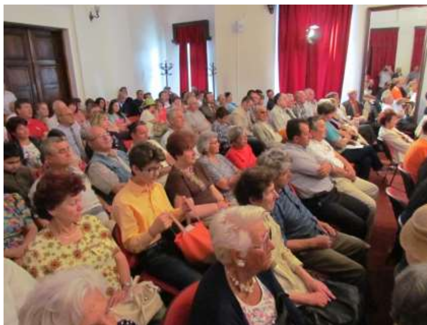
Vedere din sala Primăriei cu participanții la Simpozionul „Slove Muscelene“ 2014