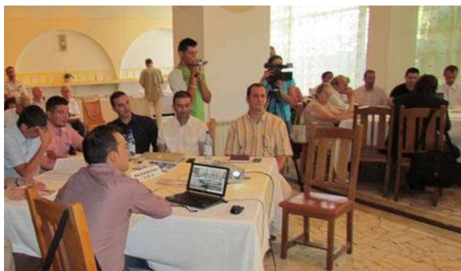
Tineri cercetători de la Institutul Național de Cercetare-Dezvoltare în Informatică ICI București