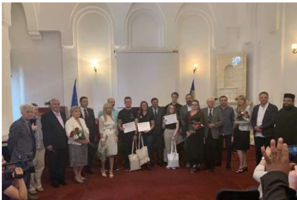
Premierea grupului de elevi de la Liceul „Dinicu Golescu” din Câmpulung