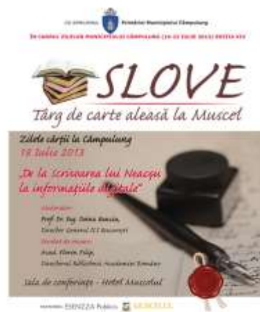
2013 – De la Scrisoarea lui Neaçu la informaţiile digitale