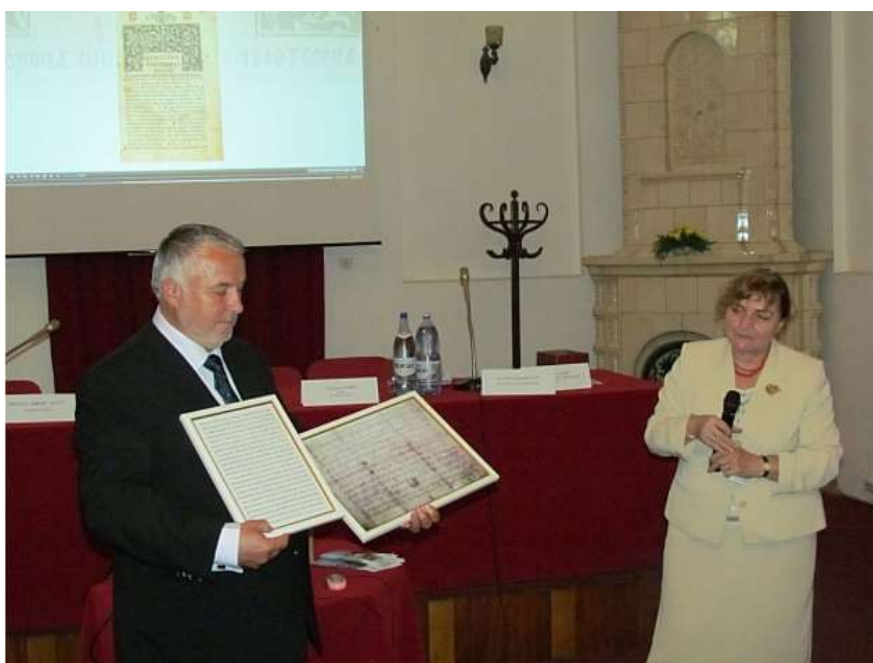
Copia Scrisorii lui Neacșu în tablou oferită Bibliotecii Municipale „Ion Barbu” din Câmpulung