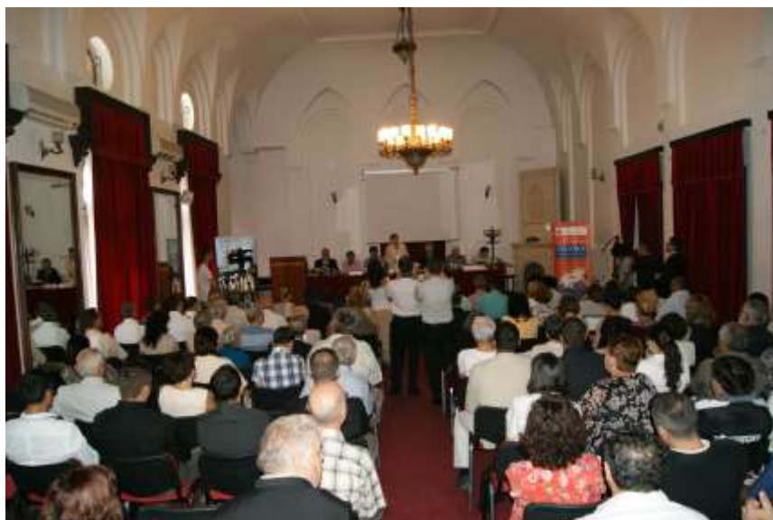
Vedere din sala Primăriei Municipiului Câmpulung cu participanții la simpozion