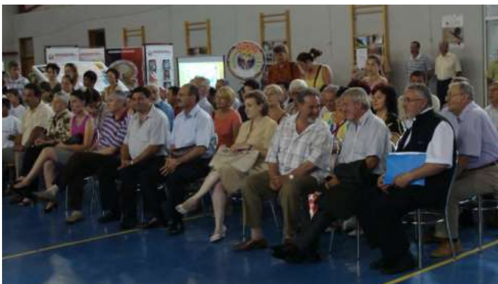
Participanți Simpozion „Slove Muscelene“ 2010 Printre participanți europarlamentarul Mircea Diaconu (al doilea din dreapta) și senatorul Gheorghe Marin (al cincilea din dreapta)