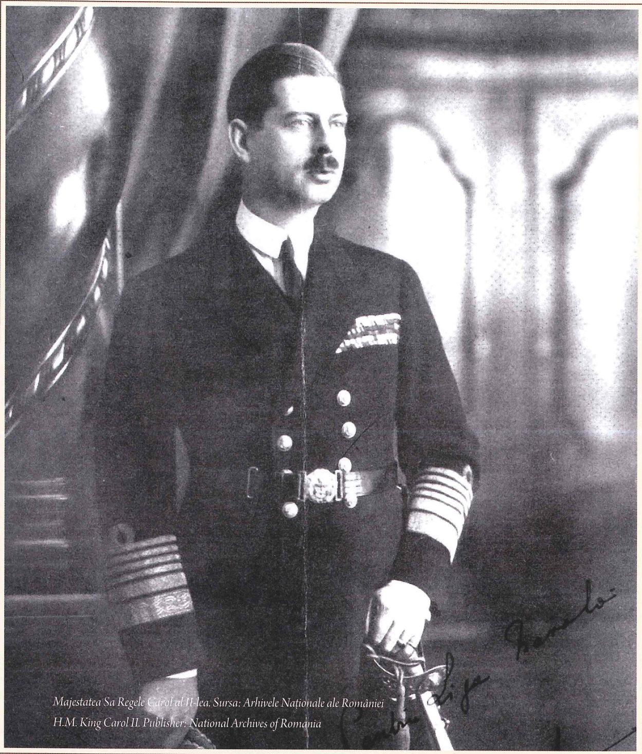
Majestatea Sa Regele Carol al II-lea. H.M. King Carol II.