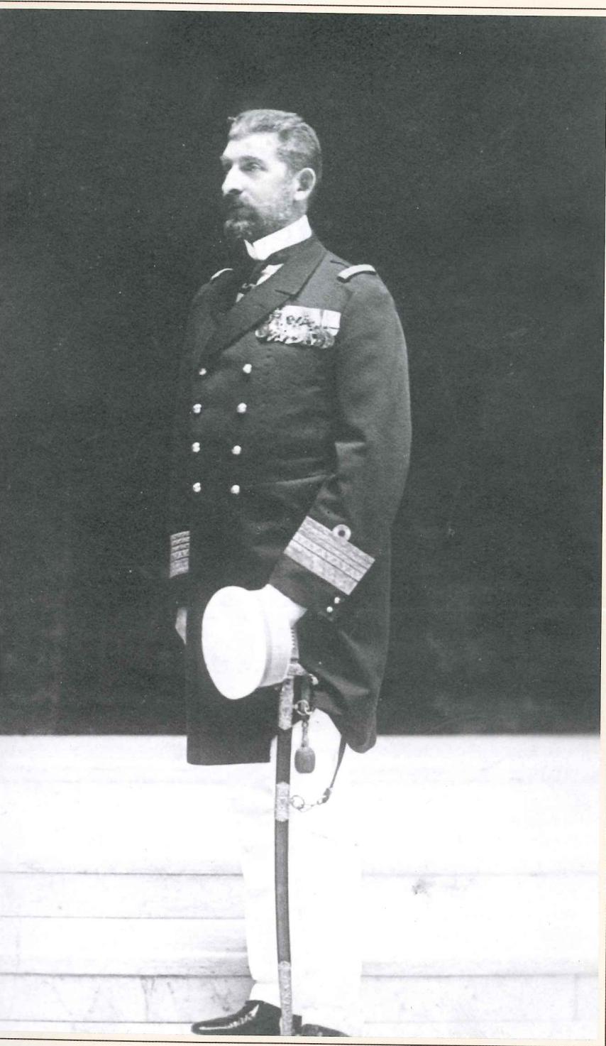
Majestatea Sa Regele Ferdinand I.