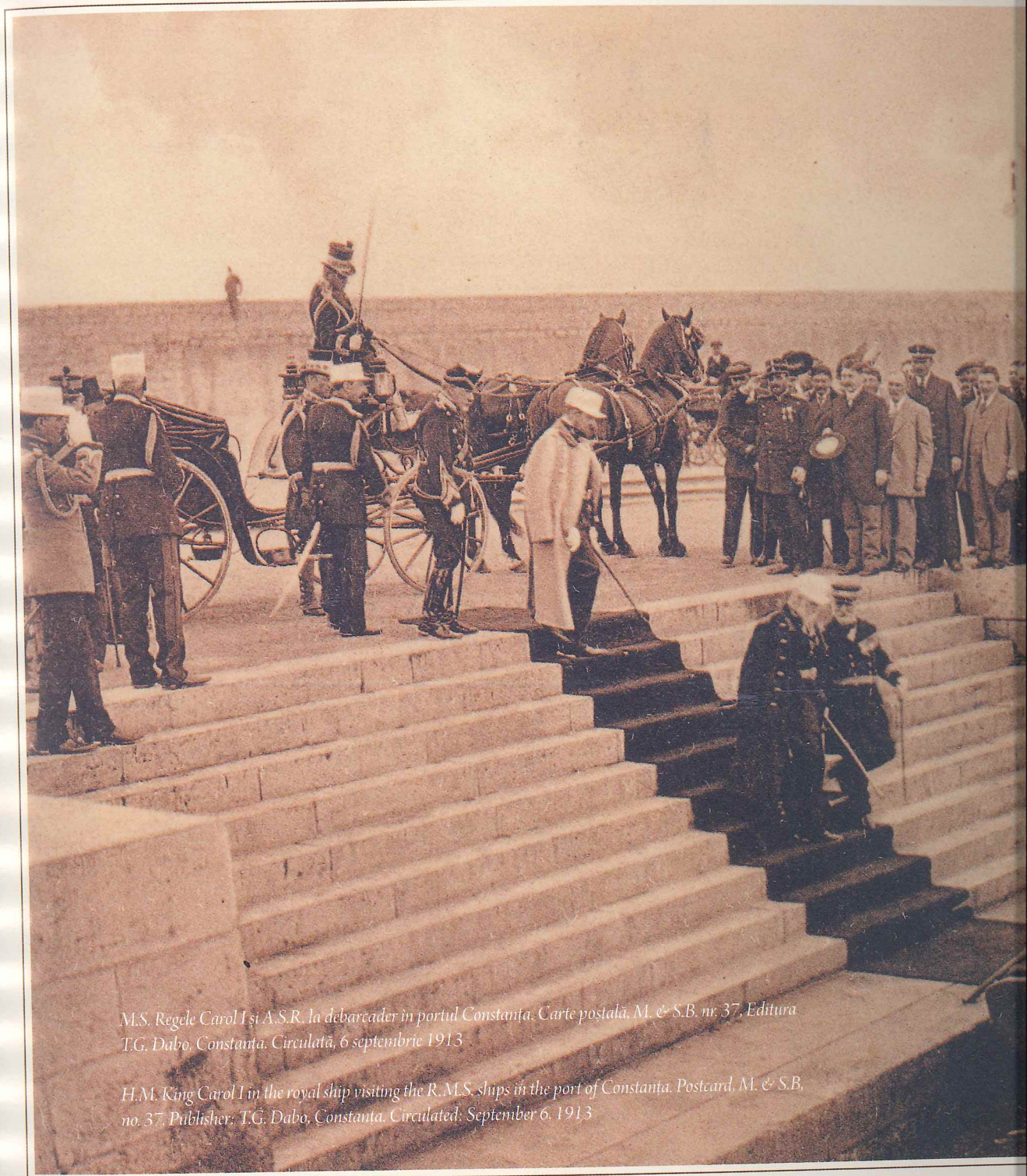
M.S. Regele Carol I și A.S.R. la debarcader în portul Constanța. Carte poștală, M. & S.B. nr. 37, Editura T.G. Dabo, Constanța. Circulată, 6 septembrie 1913

On August 14, 1895, the “Medea” left on its first regular voyage, from Brăila to Constantinople, and on August 26, 1895, the “Meteor” also departed on its first voyage.