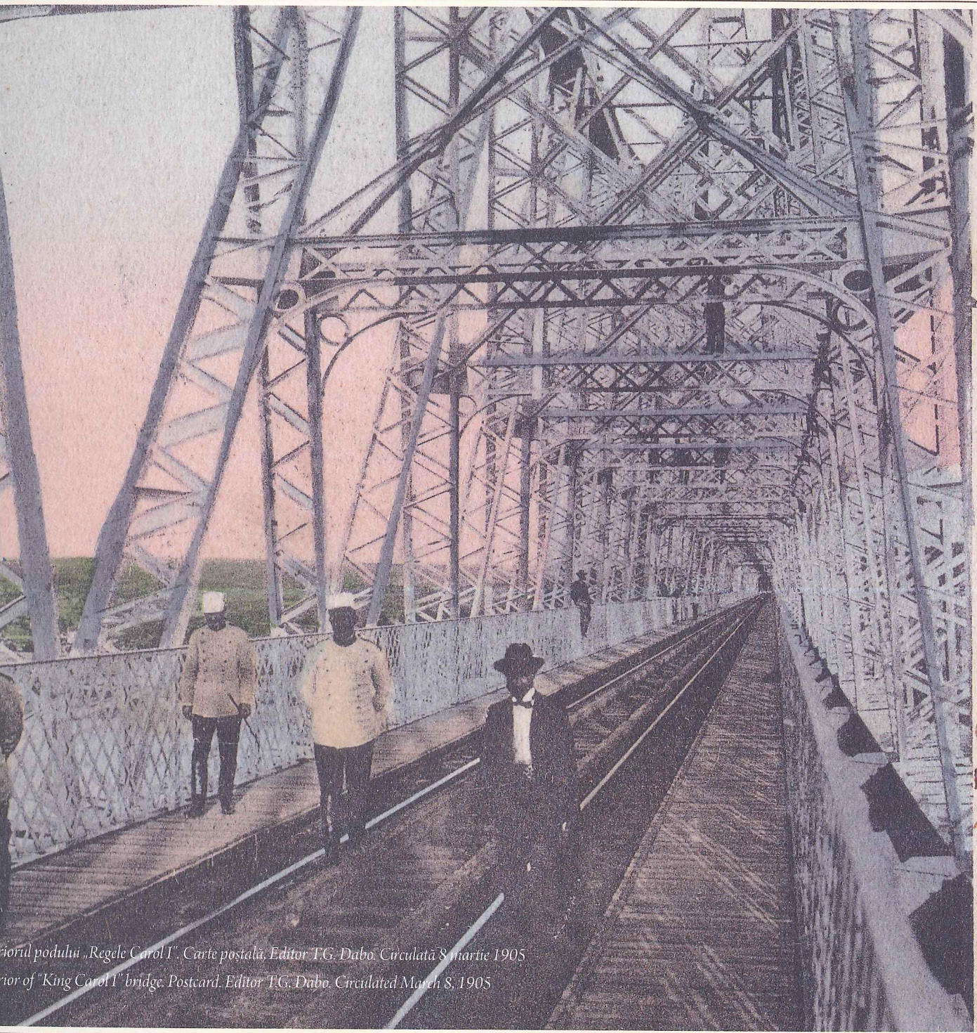
Interior of the 'King Carol I' bridge. Postcard. Editor T.G. Dabo. Circulated March 8, 1905