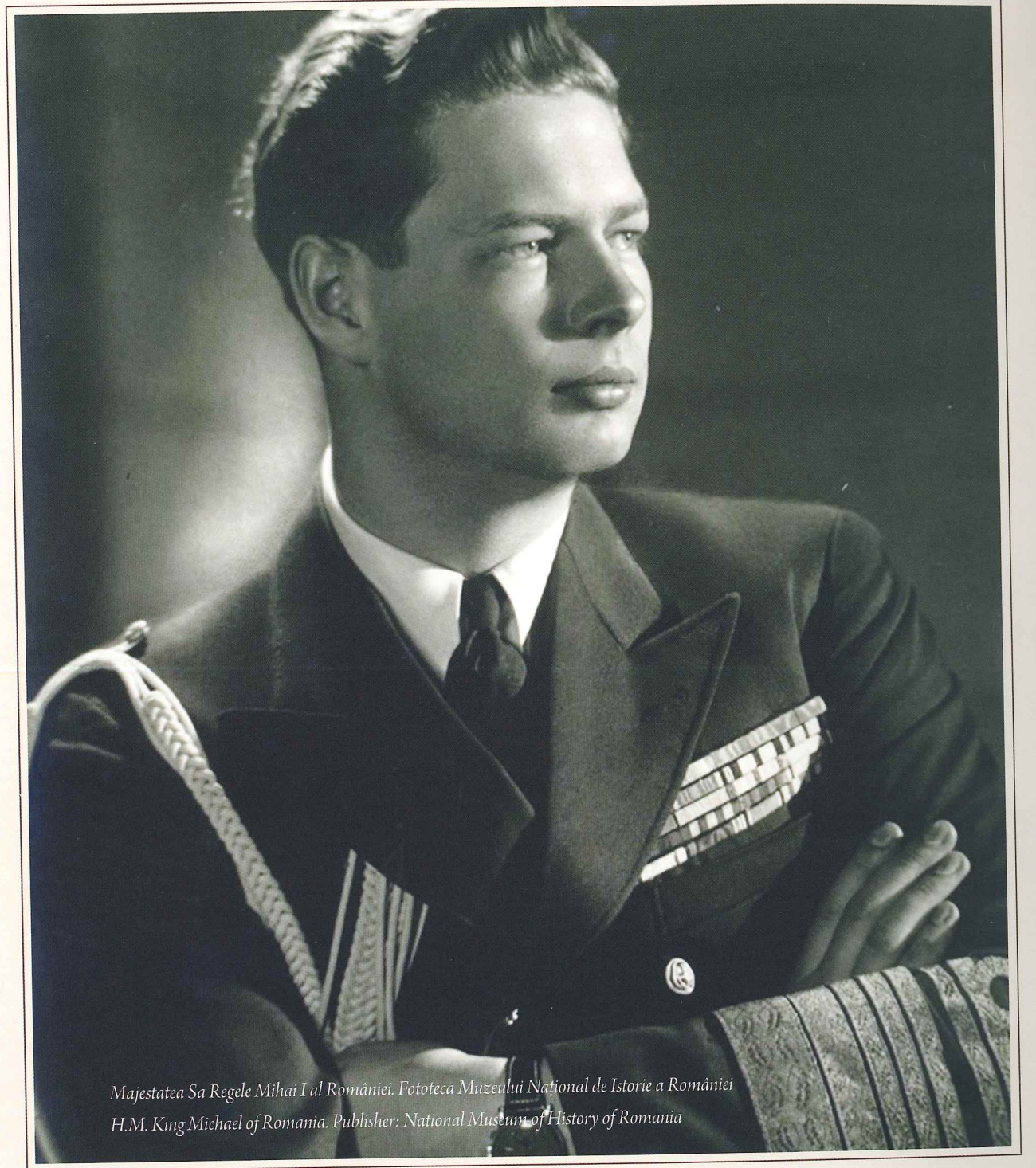
Majestatea Sa Regele Mihai I al României. H.M. King Michael of Romania.