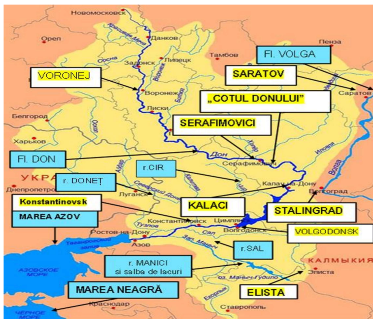
Rețeaua hidrografică și principalele localități din regiunea Donului 23 (prelucrare).

Privind delimitarea geografică a ținutului Donului se apreciază că acesta cuprinde regiunea de pe ambele părți ale Donului Mijlociu și Inferior și se întinde spre sud-est, până la linia dealurilor Jergeni, spre sud până la depresiunea Manîci și spre sud-vest până la Doneț. Stepa Calmucă este de fapt o prelungire spre sud-est a ținutului Donului, cuprins între Volga și Marea Caspică, până la Manîci.