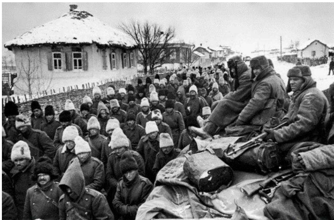
Prizonieri români și nu numai, după „Bătălia Stalingradului” (Cotul Donului -Stalingrad - Stepa Calmucă) 38 .