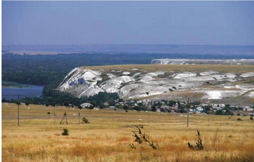
Donul și malurile sale înalte și calcaroase în dreptul Marelui Cot 24 . (Foto Vasile Șoimaru).