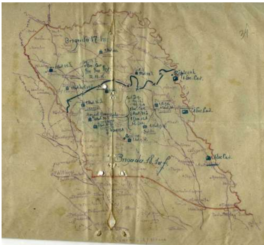
Fig. nr. 2, Forțele militare de pază și dislocate în județele Botoșani și Dorohoi. CSPAMI-Pitești, Fond, 4482-Regimentul 9 Vânători, Ds. 31, filele 33-34.

Nu întâmplător, această parte a țării constituia „Zona întâi”. La scurtă vreme zona a fost divizată în două sectoare, supravegheate de Brigăzile 17 (în județul Dorohoi) și 18 (în județul Botoșani) ale Diviziei a IX-a comandată de generalul Rujinski A. Dumitru. Brigada 17, pusă sub comanda generalului Stan Poetaș, se constituia din Regimentele 34 și 40 Infanterie și 18 Obuziere și un escadron din Regimentul 1 Călărași; Brigada 18, comandată de colonelul Scărlătescu avea în componere Regimentele 9 Vânători, 35 și 36 Infanterie, 1 Călărași și 13 Artilerie. La 19-20 decembrie 1917/1 -2 ianuarie 1918 Divizia 9-a era integral dislocată în cele două județe străjuindu-le pe linia Mihăileni – Hăvârna – Săveni – Ripiceni – Ștefănești – Bivolari. În interior trupele erau plasate strategic, pentru a supraveghea și, la nevoie, pentru a se deplasa cu ușurință spre destinațiile impuse de situație (Fig. nr. 2).